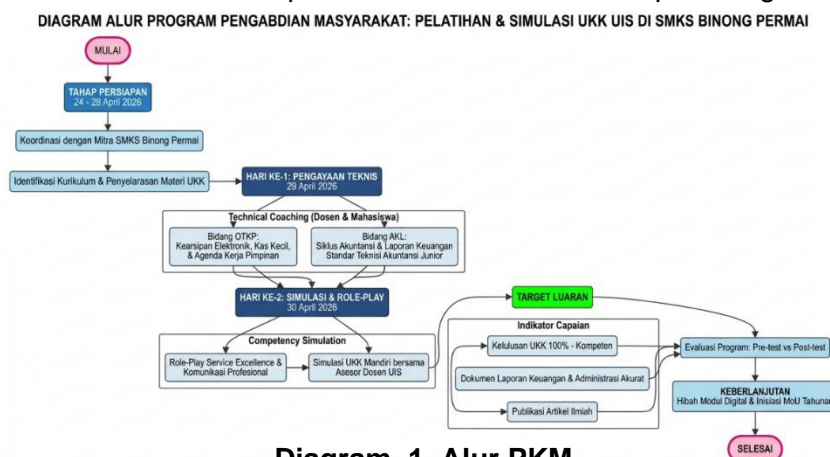
Diagram 1. Alur PKM Pelatihan dan Simulasi Uji Kompetensi Keahlian

Kegiatan Pengabdian kepada Masyarakat (PKM) ini dilaksanakan dengan menggunakan pendekatan Vocational Intensive Mentoring yang dirancang khusus untuk mengatasi kesenjangan kompetensi siswa SMK dalam menghadapi sertifikasi industri. Strategi utama berfokus pada transformasi teknis dan internalisasi etika profesional melalui dua tahapan integratif.