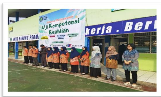
Gambar 1. Persiapan Uji Kompetensi Keahlian SMKS Binong Permai

Kemampuan akuntansi dan keuangan Lembaga (AKL) adalah hasil belajar dalam lingkup Akuntansi Dasar yang dipandang sebagai wujud nyata dari perubahan tingkah laku siswa yang terbentuk melalui pengalaman dan interaksi lingkungan yang konsisten. Agar perkembangan tersebut dapat dipantau secara akurat, pengajar perlu melakukan asesmen yang tepat. Hal ini bertujuan untuk memetakan kapasitas siswa dalam menginternalisasi materi akuntansi yang telah disamp (Naim & Djazari, 2019).