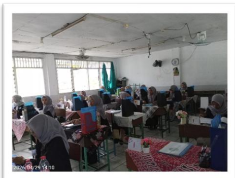
Gambar 4. Siswa Akuntansi praktek langsung dengan diawasi oleh team penguji