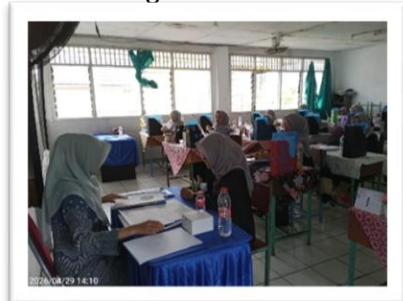
Gambar 2. Penguji Otomatisasi dan Tata Kelola Perkantoran (OTKP), Wawancara dengan para peserta

Keberhasilan program ini didukung penuh oleh partisipasi aktif mitra, di mana SMKS Binong Permai secara mandiri memobilisasi seluruh siswa tingkat akhir dan menyediakan fasilitas laboratorium komputer serta ruang praktik perkantoran yang memadai. Implementasi ipteks yang menggabungkan otomatisasi administrasi modern dan standar akuntansi presisi ini akan diintegrasikan lebih lanjut melalui penyusunan nota kesepahaman (MoU) agar program pendampingan ini dapat menjadi agenda rutin tahunan demi mendukung kemandirian ekonomi lulusan vokasi di wilayah Tangerang.